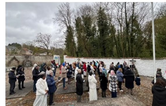
Chemin de croix au domaine marial