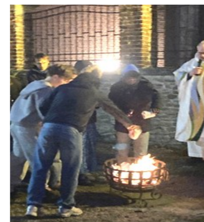
Veillée pascale à Péruwelz